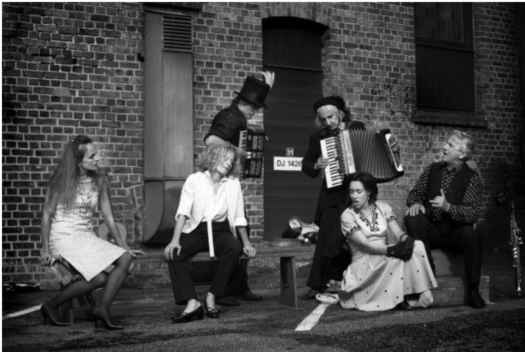
Con suoni e con canti. Versione all'aperto e itinerante dello spettacolo "E d'ammuri t'arricordi", TTB.-Porsgrunn- Norvegia giugno 2006

Articoli pubblicati in AsiaTeatro , Anno VII (2017)