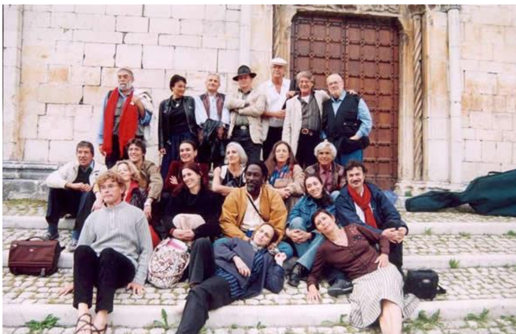
Il Teatro Tascabile di Bergamo e l'Odin Teatret all'Aquila, alla fine del seminario "I teatri e le loro città", 20 maggio 2004.

formazione dell'artista e sul rapporto di questo con la realtà che lo circonda. Incontri e corsi per le scuole e il pubblico hanno lo scopo di promuovere la conoscenza qualificata della cultura teatrale rinsaldando le relazioni fra esecutori e fruitori. Si deve al TTB la conoscenza e la diffusione in Italia del teatro-danza orientale, ambito in cui è uno dei maggiori specialisti in Occidente.