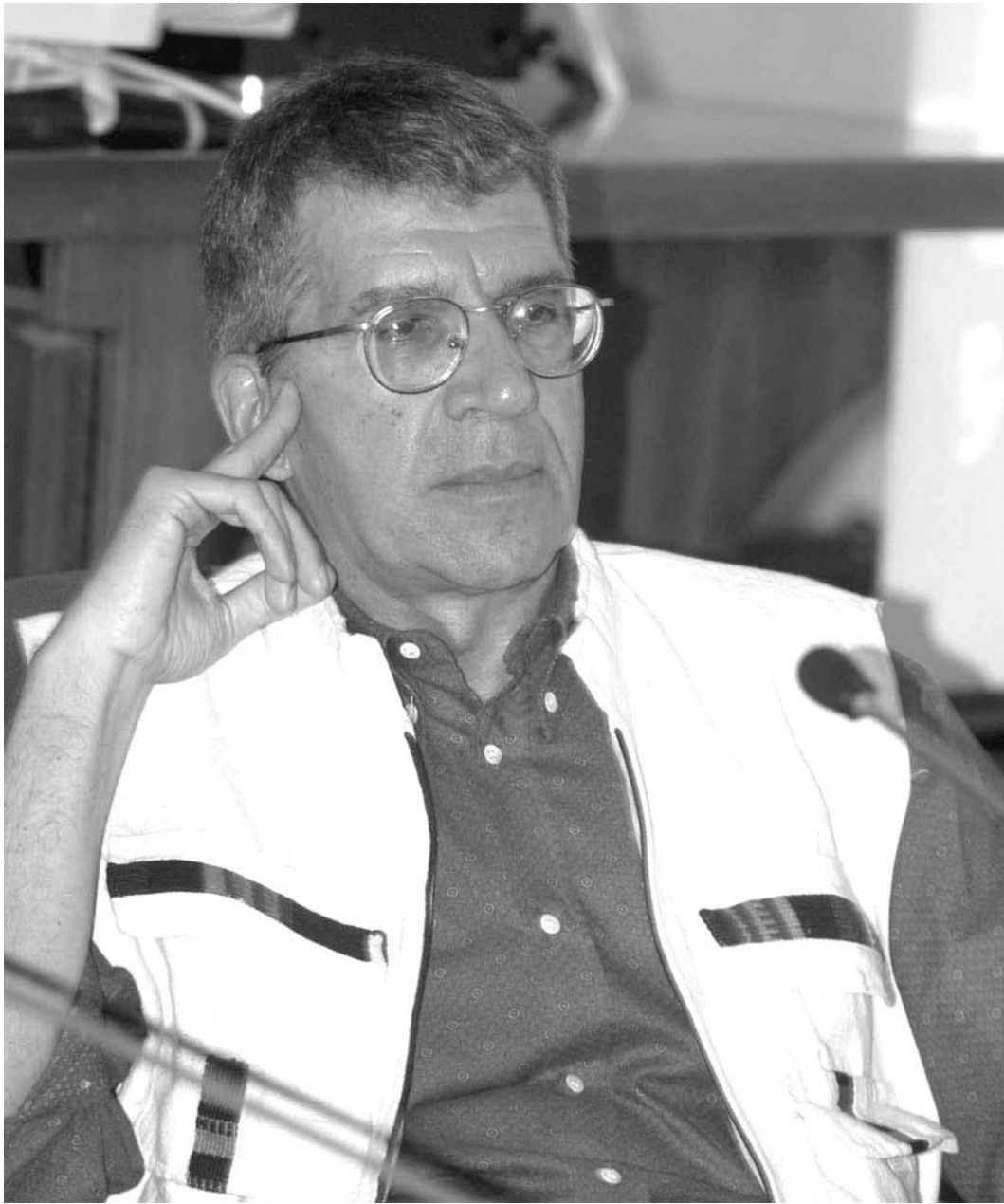
Renzo Vescovi nel 2004.

Autore di diversi saggi, è stato oggetto di oltre una ventina di tesi di laurea in una decina di università italiane e straniere.